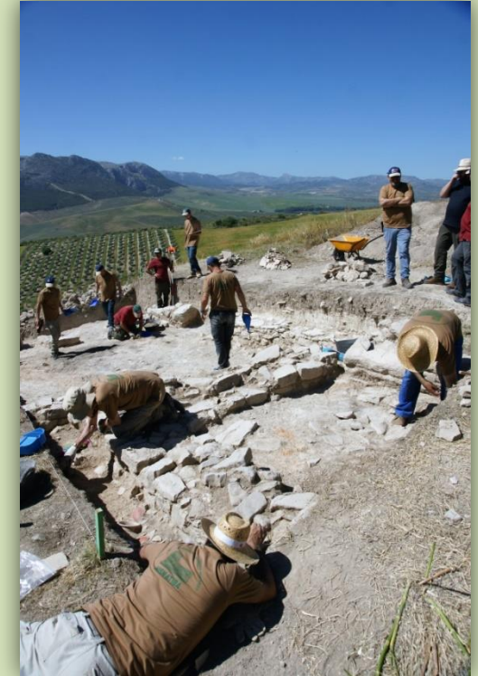
Imagen de las excavaciones llevadas a cabo en 2019 en el yacimiento de Los Castillejos de Teba

14:00 h. Almuerzo de la Asociación Hisn Atiba. Lugar: Zona recreativa de La Puente.