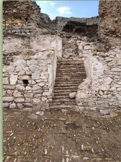
Monumental escalera de acceso al alcázar del Castillo descubierta en la actual campaña de excavaciones

12:30 h. Visita guiada al Museo Histórico Municipal de Teba a cargo de miembros de la Asociación Hisn Atiba.